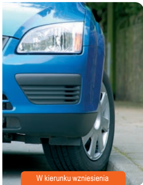
W kierunku wzniesienia

Parkując pojazd w kierunku wzniesienia, koła pojazdu należy ustawić w kierunku przeciwnym do krawężnika Parkując pojazd w kierunku przeciwnym do wzniesienia, koła pojazdu należy ustawić w kierunku krawężnika