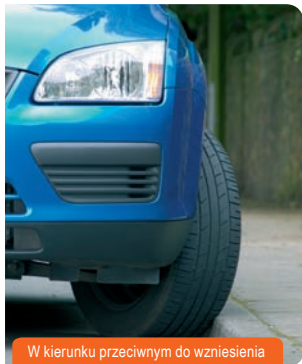
W kierunku przeciwnym do wzniesienia